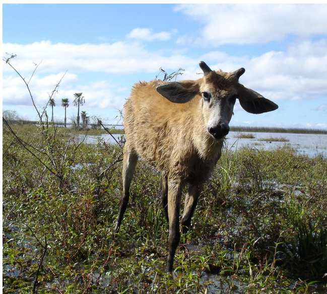
Fig. 2. Ciervo de los pantanos presentando debilidad, edema submandibular y diarrea durante el invierno de 2007 en la Reserva Natural del Iberá, Corrientes, Argentina.

clínicamente normal. El estado general fue malo y el estado corporal deficiente ( Fig. 2 ). En los estudios coproparasitológicos se hallaron 3180 hpg para heces frescas procedentes del Bd 1 y 8460 hpg en Bd 2. Días más tarde se halló muerto al Bd 1 y se tomaron muestras de contenido intestinal, obteniendo 27 120 hpg. Los parásitos adultos hallados fueron identificados como Haemonchus contortus (Rudolphi, 1803).