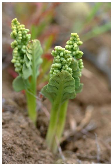
FIGURA 2. Botrychium dusenii , espécimen de la Reserva Nacional Jeinimeni.