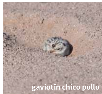
gaviotín chico pollo

E l gaviotín chico ( Sterna lorata ) es una especie en peligro de extinción, posee una coloración general gris y blanco, presenta la cabeza con negro en la nuca. El pico es amarillo con la punta negra. Se ha observado en el humedal de la desembocadura del río Lluta y