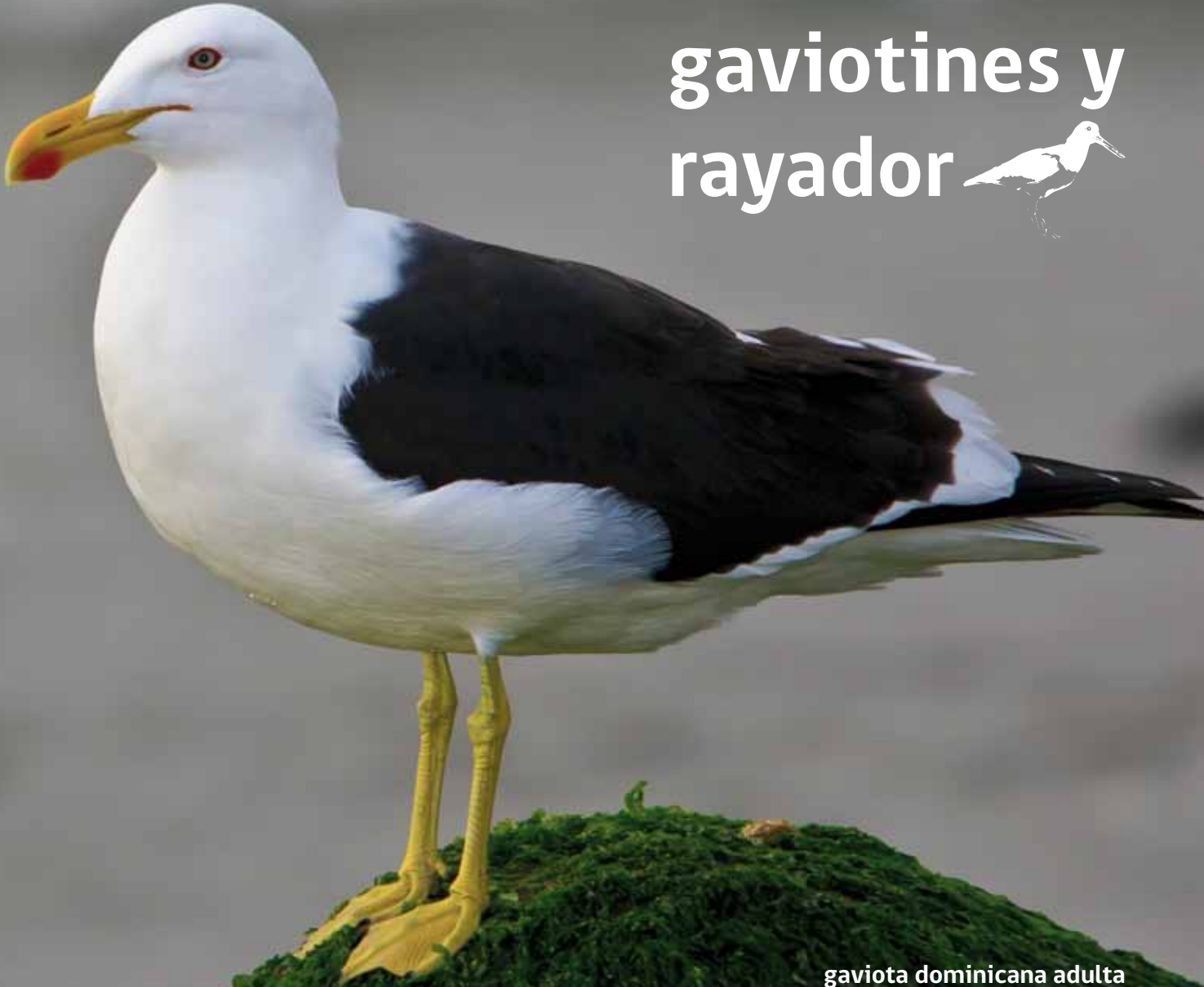
gaviota dominicana adulta