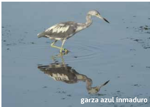
garza azul inmaduro

La garza azul ( Egretta caerulea ) se puede observar durante todo el año a lo largo de toda la costa de Arica. En general esta especie es de color azul, pero en estado juvenil presenta un plumaje de coloración blanca que puede llevar a confundirla con otras especies de garzas. Durante la fase de transición de plumaje juvenil a adulto, presenta una coloración mixta entre plumas blancas y azules.