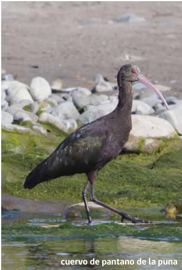
cuervo de pantano de la puna