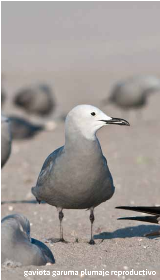
gaviota garuma plumaje reproductivo