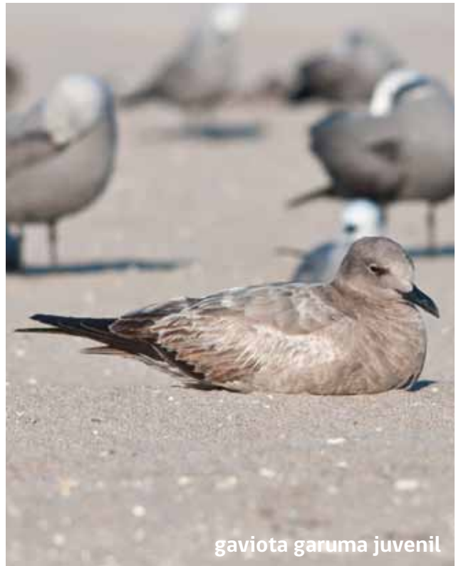
gaviota garuma juvenil

E ste grupo de aves costeras está presente en todo el borde costero, en este grupo de aves encontramos especies migratorias y residentes.