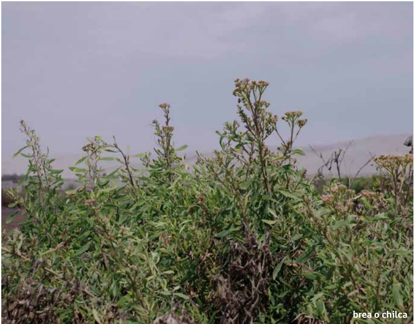
brea o chilca

La brea o sorona o chilca ( Tessaria absinthioides ) es un arbusto que puede alcanzar hasta 1,5 m. de altura, siempreverde. Su follaje presenta un color verde claro y algo grisáceo. Presenta hojas