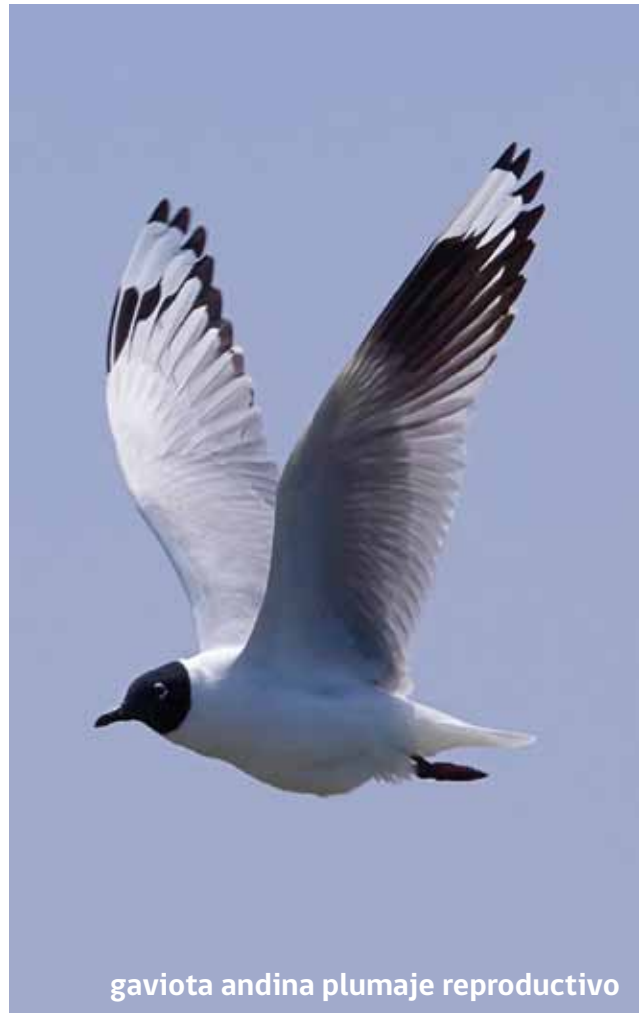
gaviota andina plumaje reproductivo

La gaviota andina ( Larus serranus ) es una especie típica del altiplano, pero presenta migraciones desde el altiplano a la costa y de la costa al altiplano. Es común observarla en la costa durante el período de otoño-invierno, ya que en el período estival migra para nidificar en el altiplano. Se observa