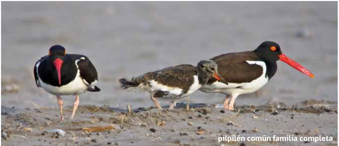
pilpilén común familia completa