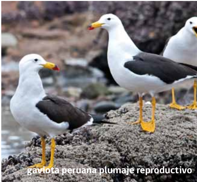
gaviota peruana plumaje reproductivo