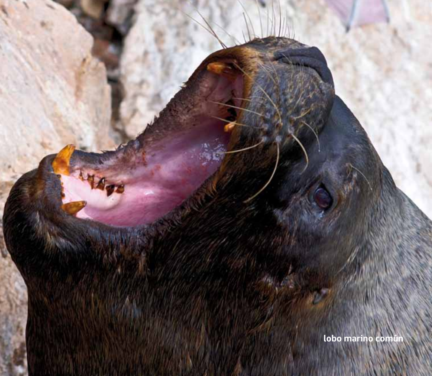
lobo marino común