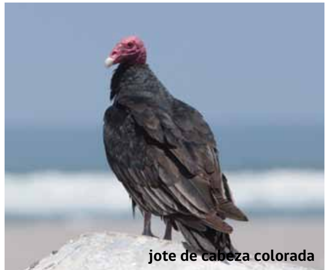
jote de cabeza colorada

Estas rapaces se pueden observar en todo el borde costero, valles y quebradas de la zona.