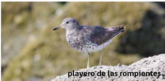
playero de las rompientes