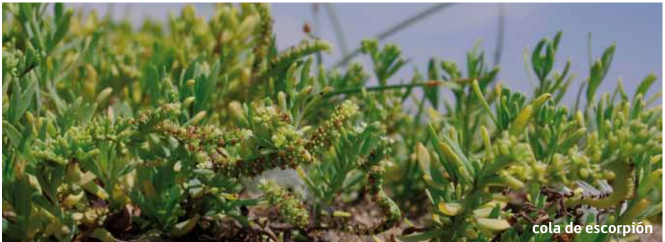
cola de escorpión

La cola de escorpión ( Heliotropium curassavicum ) es una planta anual o perenne, suculenta, sin pelos, verde-azulosa a azul-grisáceo, por lo general con la ramificación dirigida hacia arriba. Su tallo es postrado o sin fuerza para mantenerse erguidos