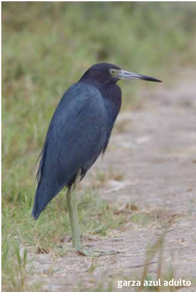
garza azul adulto