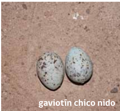
gaviotín chico nido