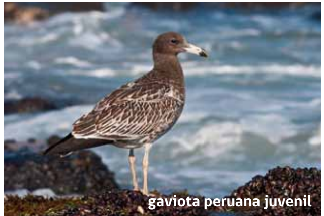
gaviota peruana juvenil

Otra especie común en todo el borde costero es la gaviota peruana ( Larus belcheri ), esta gaviota se caracteriza por tener el pico y patas amarillas intenso, además en la punta del pico presentan una banda negra con rojo. Durante el período