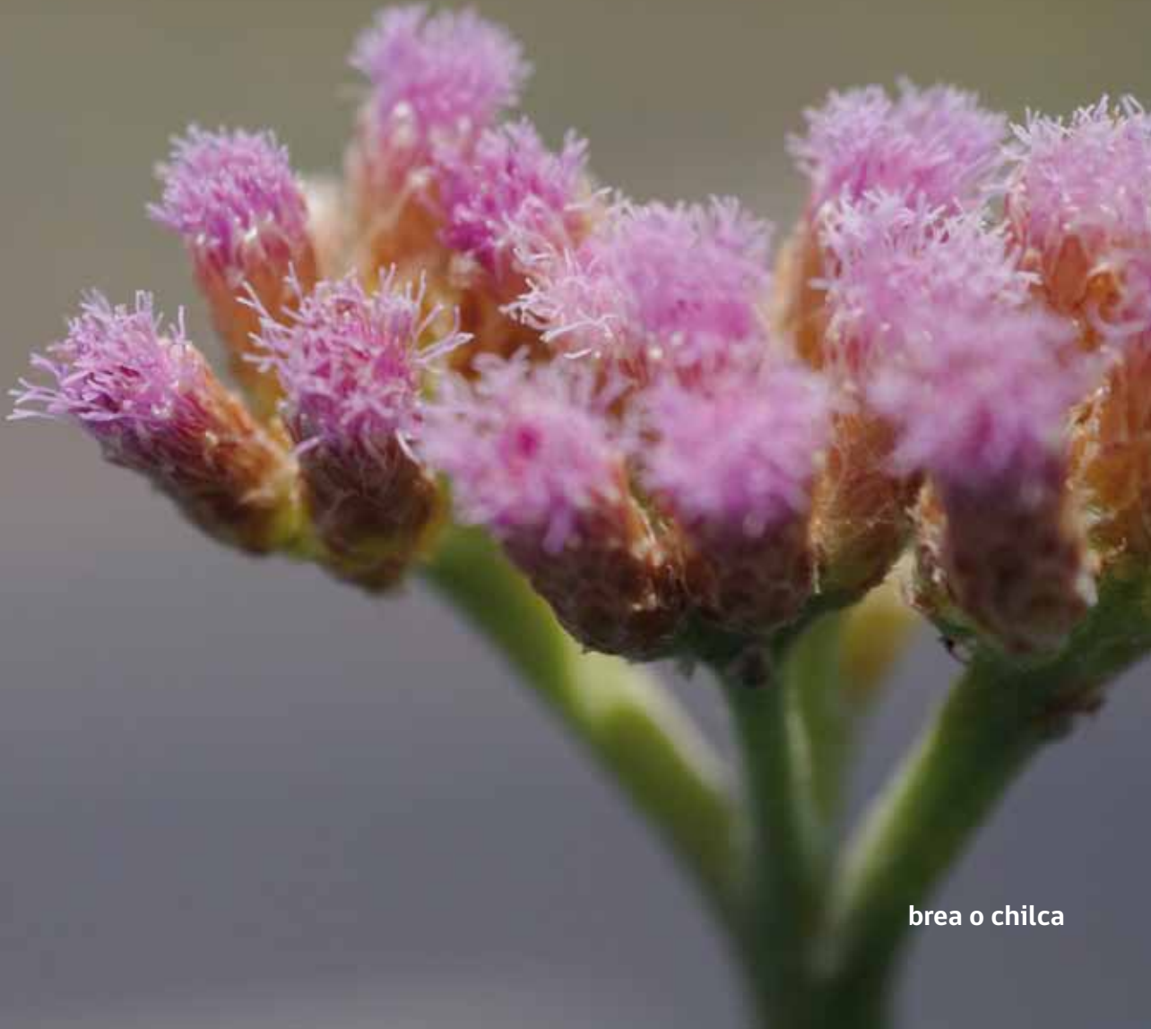
brea o chilca