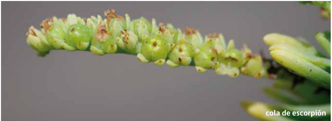
cola de escorpión