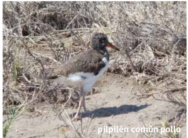
pilpilén común pollo

Los pilpilenes son robustos, de patas largas y pico largo y firme comprimido lateralmente.