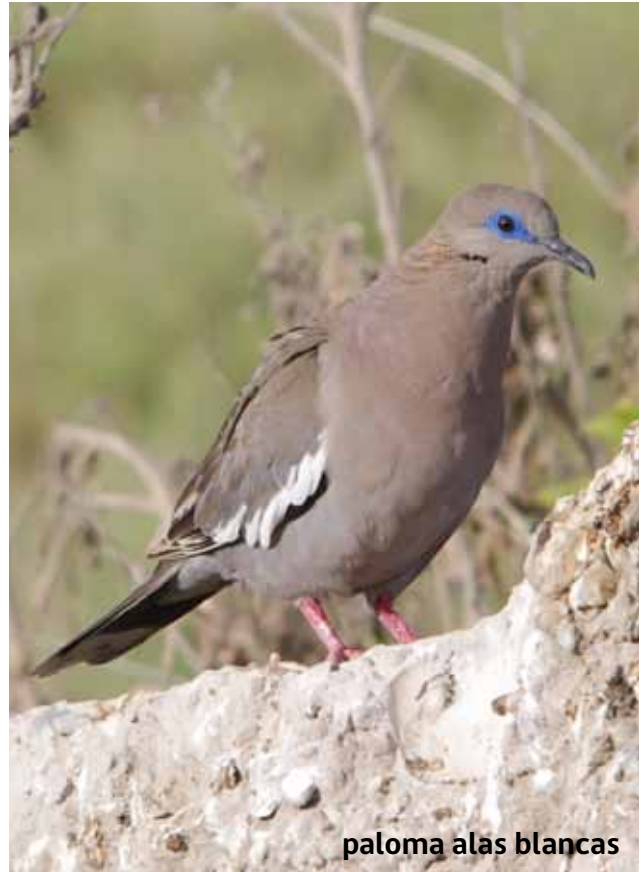
paloma alas blancas

M uchas de estas especies se pueden observar asociadas al humedal de la desembocadura del río Lluta. También son comunes en plazas, jardines y valles.