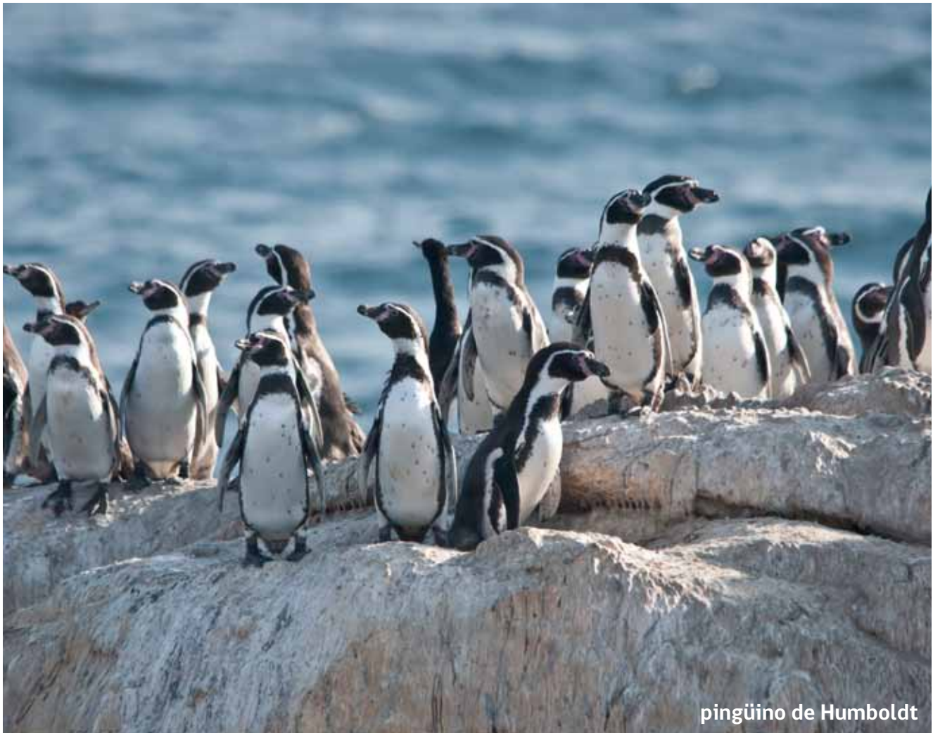
pingüino de Humboldt

E l pingüino de Humboldt ( Spheniscus humboldtii ), es la única especie de pingüino presente en la zona, es típica de la corriente de Humboldt. Es un ave no voladora, sin embargo es una excelente nadadora y muy buena cazadora de peces.