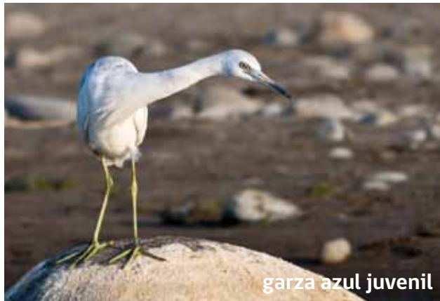
garza azul juvenil