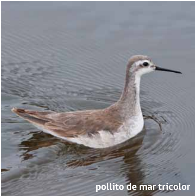
pollito de mar tricolor