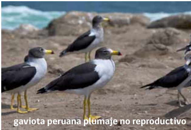
gaviota peruana plumaje no reproductivo