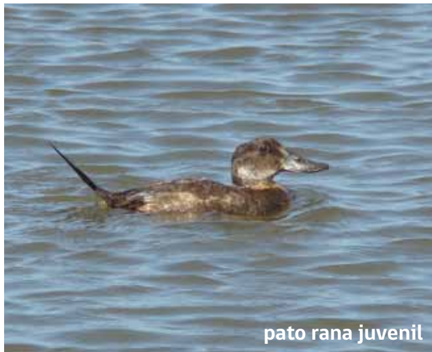
pato rana juvenil

Las otras especies de patos observados en el humedal son menos comunes, como el pato rana de pico ancho ( Oxyura jamaicensis ), pato juarjual ( Anas specularioides ), pato puna ( Anas puna ), pato