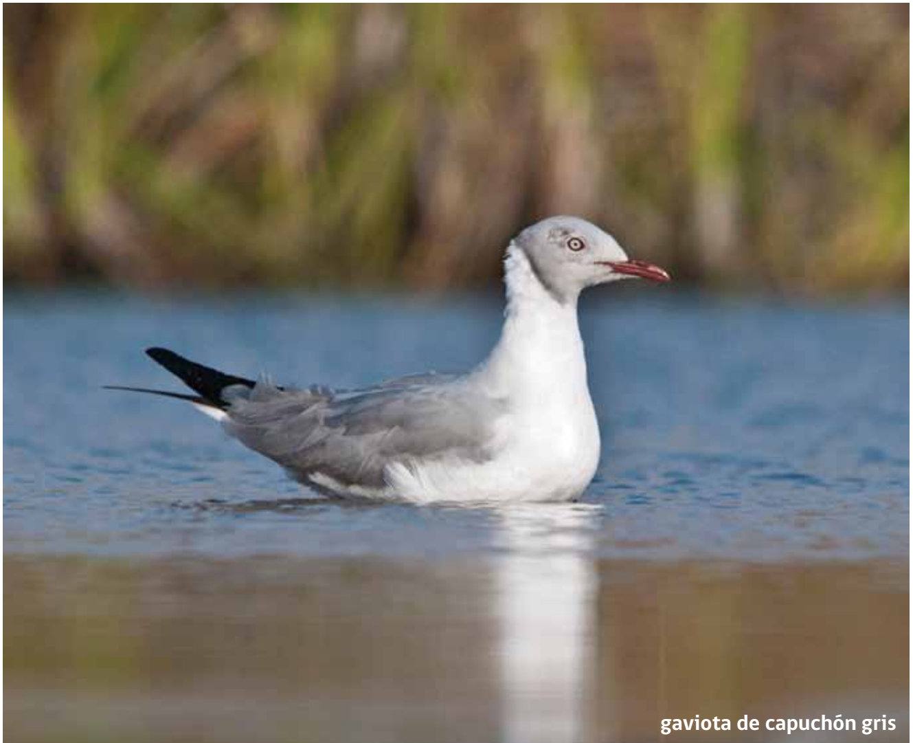
gaviota de capuchón gris

Una gaviota poco común, ya que en Chile sólo existen registros en el borde costero de Arica en la playa Las Machas y en la desembocadura del río Lluta