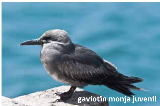
gaviotín monja juvenil

E l gaviotín monja ( Larosterna inca ) es un ave residente típica del borde costero de Arica, de color general gris pizarra, con plumas blancas que salen de la base del pico como bigotes, los que son muy característicos, el pico y patas son de color rojo. Este gaviotín se reproduce en acantilados costeros, pero también se registra su nidificación en el puerto. Los juveniles presentan plumaje más opaco con plumas de color café.