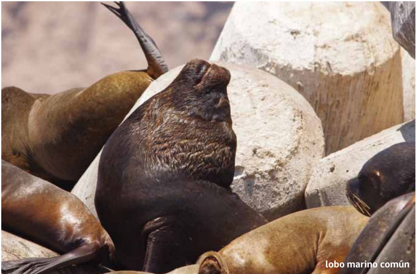
lobo marino común

E l lobo marino común es una especie abundante en todo el borde costero de Arica, se le puede observar nadando a lo largo de la costa como en la zona del puerto.