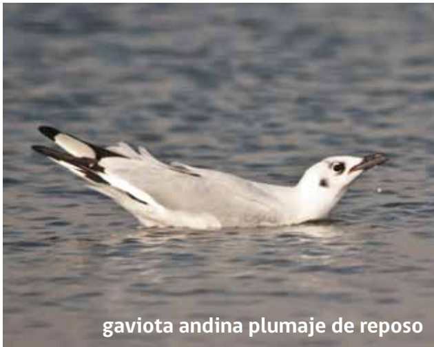
gaviota andina plumaje de reposo