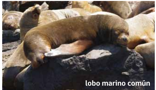
lobo marino común

E l lobo marino común es una especie abundante en todo el borde costero de Arica, se le puede observar nadando a lo largo de la costa como en la zona del puerto.