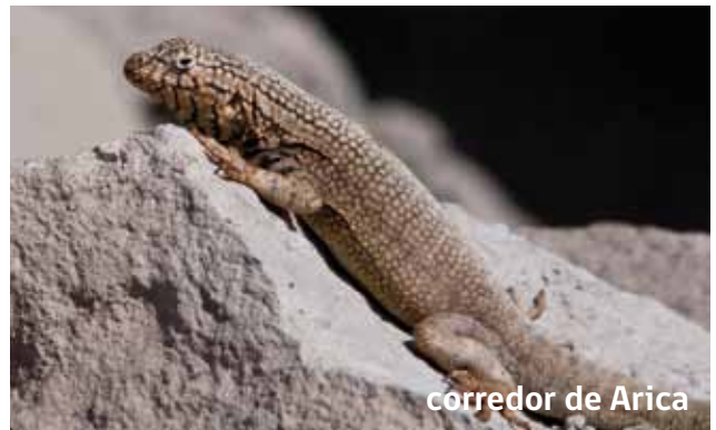
corredor de Arica

Las lagartijas observadas en la zona corresponden al corredor de Arica ( Microlophus heterolepis ) y al corredor de cuatro bandas ( Microlophus quadrivittatus ). Aunque existen otras especies en la región, éstas son las más comunes en el borde costero.