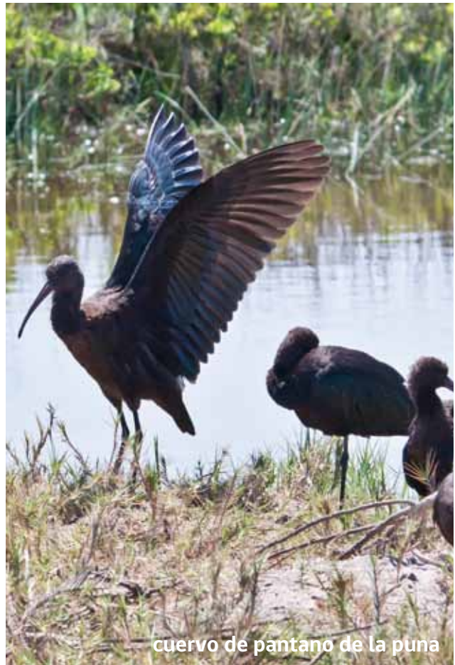
cuervo de pantano de la puna

L a bandurria de la puna es un ave poco común, aunque se ha registrado en varias oportunidades en los valles agrícolas de la zona y en el humedal de la desembocadura del río Lluta.