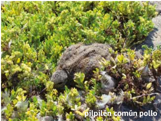
pilpilén común pollo