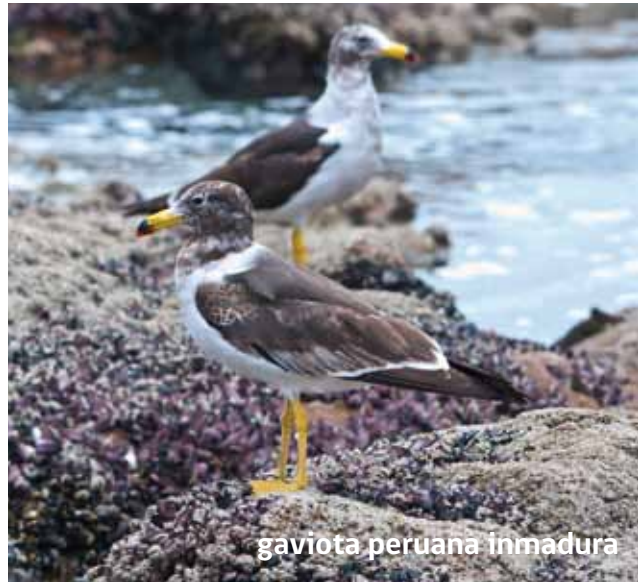
gaviota peruana inmadura