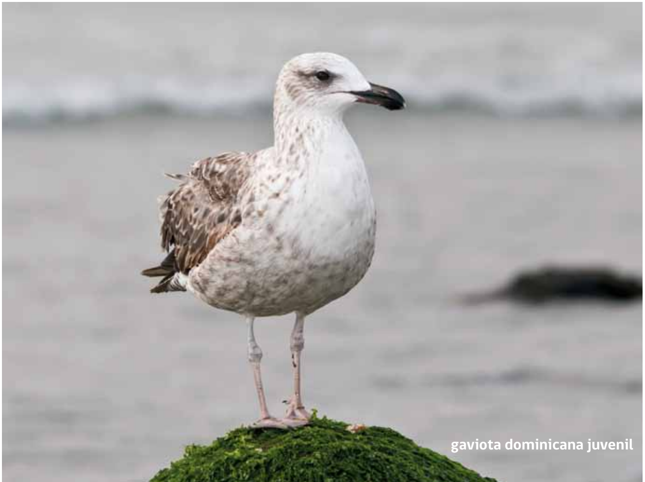
gaviota dominicana juvenil

La gaviota dominicana ( Larus dominicanus ) también es una especie común del borde costero. Se puede confundir con la gaviota peruana, pero en estado adulto esta especie no presenta la cabeza oscura y su plumaje no cambia de color en el período reproductivo. Los juveniles son café con gris