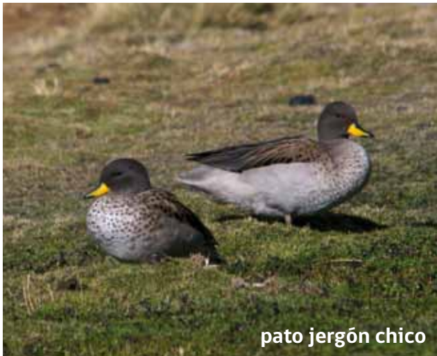
pato jergón chico