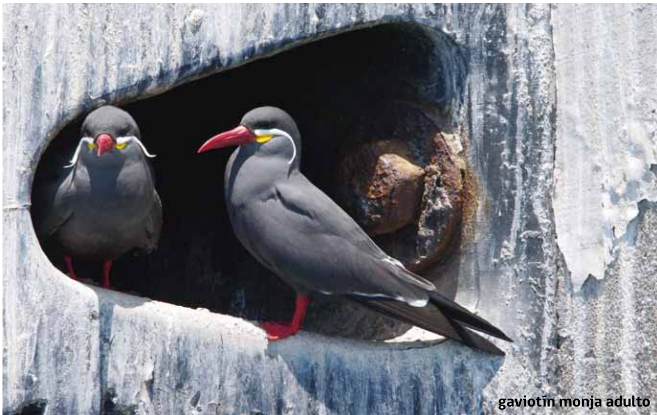
gaviotín monja adulto

E l gaviotín monja ( Larosterna inca ) es un ave residente típica del borde costero de Arica, de color general gris pizarra, con plumas blancas que salen de la base del pico como bigotes, los que son muy característicos, el pico y patas son de color rojo. Este gaviotín se reproduce en acantilados costeros, pero también se registra su nidificación en el puerto. Los juveniles presentan plumaje más opaco con plumas de color café.