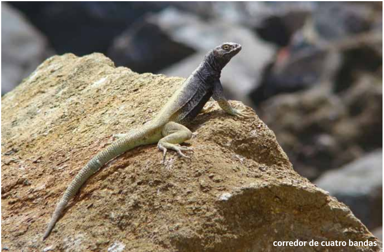
corredor de cuatro bandas

E ste grupo de animales, aunque presenta menos especies en el borde costero, registra dos especies de lagartijas, y una especie de tortuga marina.