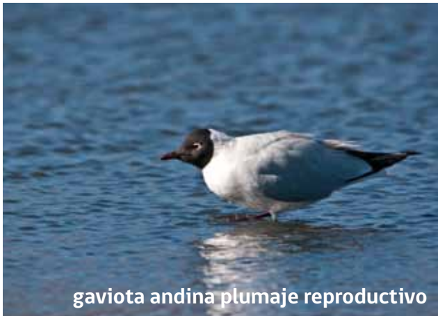
gaviota andina plumaje reproductivo