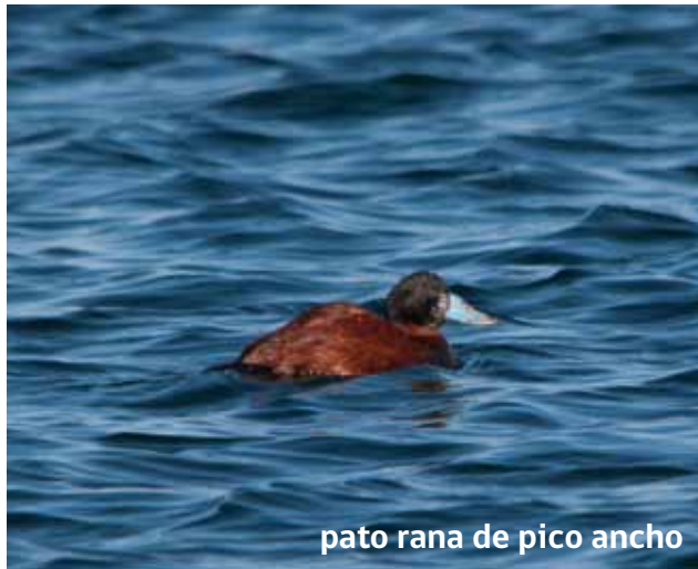
pato rana de pico ancho