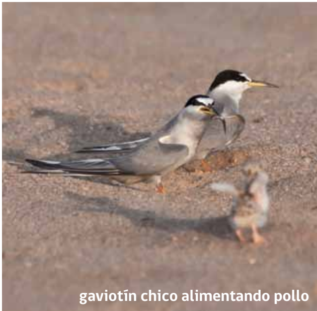
gaviotín chico alimentando pollo