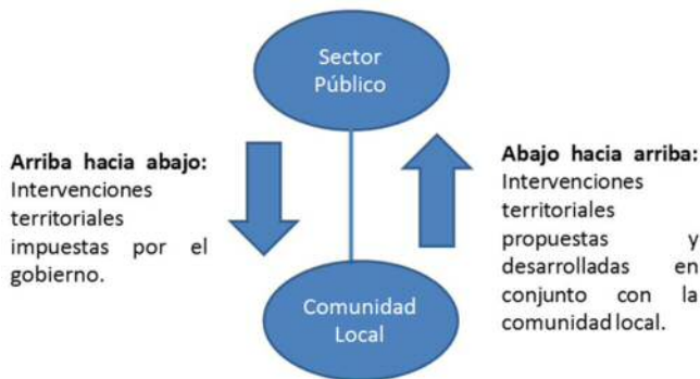
Figura 2. Direcciones de la gobernanza

En este artículo, se comprende a la gobernanza como una alianza entre el sector público, privado y comunidad local, para hacer frente a problemas territoriales y desarrollar posibles soluciones, estrategias o políticas públicas. En el último tiempo se viene considerando a la sociedad civil en la gobernanza, ya que en su origen fue desarrollada por los gobiernos para que el sector privado sea un brazo en la gestión gubernamental, sobre todo en temas económicos, en donde las decisiones de las intervenciones a desarrollar en los territorios, eran tomadas por unos pocos desde arriba hacia abajo. Sin embargo, también surgen gobernanzas de corrientes endógenas, con una lógica de abajo hacia arriba que toma fuerza, aquí las soluciones a los problemas del desarrollo territorial son impulsadas por las propias organizaciones locales y/o comunitarias (Mayntz 1998, Pacheco et. al 2014).