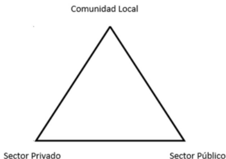
Figura 1. La gobernanza y el TBC

Se escapa de la clásica planificación turística en donde principalmente los esfuerzos recaían en tratar de coordinar al sector público con el privado, sin considerar a la comunidad local como un interlocutor válido a la hora de planificar el desarrollo turístico de un territorio o destino (Pacheco et. al. 2014).