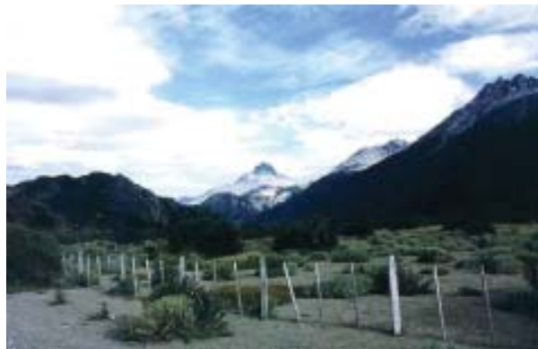
La belleza de cerro Sombrero, Carretera Austral.

En el año 1970 se crearon los Santuarios de la Naturaleza, a través de la promulgación la Ley N° 17.288 de Monumentos Nacionales. Actualmente, han sido declarados 26 sitios como Santuarios de la Naturaleza, lo que representa más de 132.868 há bajo protección oficial. De los 26 Santuarios, 14 están más bien dirigidos a la protección de áreas silvestres, tutelando hábitats relevantes para la conservación de especies de flora y fauna, tanto terrestres como de humedales. Si bien la conservación de la naturaleza es uno de los principales objetivos de los Santuarios, el cuerpo legal que los crea no establece un organismo o agencia