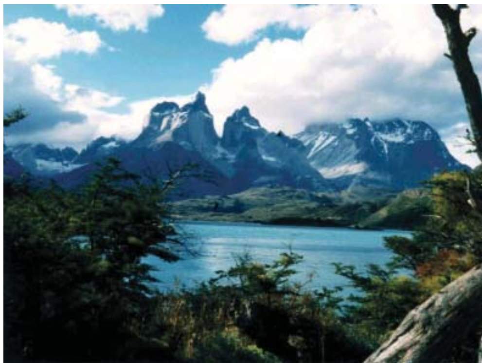
Torres del Paine, Región de Magallanes.

¿Que es posible de hacer entonces?. Todo parece indicar que un elemento central radica en un cambio de paradigma de la planificación urbana. Vale decir, pasar de la expansión urbana a planificar desde las áreas de protección y conservación, o dicho de otra manera, planificar desde los vacíos metropolitanos o «desde el negativo» para asegurar un mejor y más sustentable uso del territorio urbano. Esta nueva propuesta de planificación urbana, sumada a la implementación del Reglamento de Áreas Silvestres Protegidas Privadas, sin lugar a dudas, generarán un escenario más propicio para alcanzar una fructífera cooperación público-privada en el ámbito de la conservación del patrimonio ambiental y los recursos naturales en nuestro país, particularmente en las áreas urbanas.