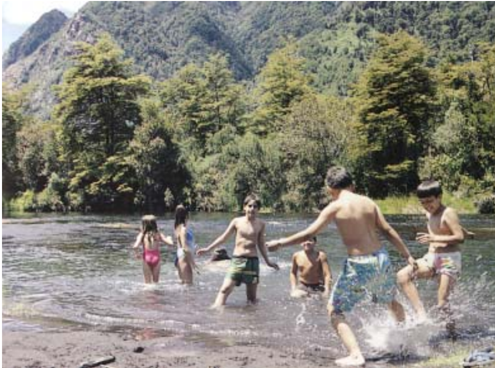
Parque Nacional Conguillío, Región de la Araucanía.

mando así esta «alianza» es una de las herramientas más efectivas, toda vez que la mayoría de estas iniciativas son predios que protegen una gran superficie y diversidad de hábitats, y otros que pueden no tener una superficie importante, pero son de gran valor natural al proteger bosques relictos o de importancia por sus recursos genéticos, por ayudar a la formación de zonas de amortiguamiento a las SNASPE o apoyar la formación de corredores biológicos. En forma complementaria, las ASP podrían participar del desarrollo productivo local, gracias a la generación de nuevas fuentes de empleo, a través de usos de bajo impacto y planes de manejo sustentables, que son más perdurables que la explotación irracional de los recursos que contienen.